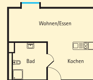
Beispielgrundriss: 25 m 2