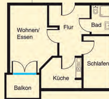
Appartement 54 qm